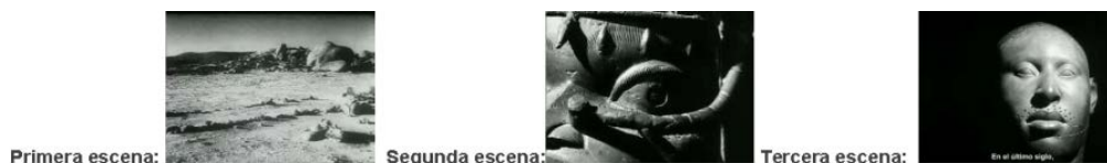
Foto 6: Fotogramas de la segunda secuencia de “Las estatuas también mueren”

En la segunda escena se mantiene el plano general en este caso en giros panorámicos de dos paisajes africanos, ambos frontales, hasta la aparición de la embarcación, en la que realiza un travelling manteniendo el enfoque en la proa de la embarcación a menudo que esta avanza por el río; en este caso realiza un picado en una representación simbólica de lo desconocido que representa la exploración del continente.