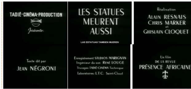
Foto 1: Fotogramas de las cortinillas de “Las estatuas también mueren”