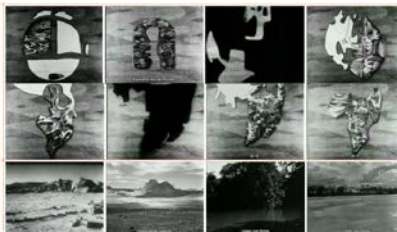
Foto 4: Fotogramas de la segunda secuencia de “Las estatuas también mueren”