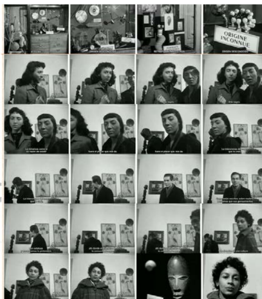
Foto 2: Fotogramas de la primera secuencia tercera escena de “Las estatuas también mueren”