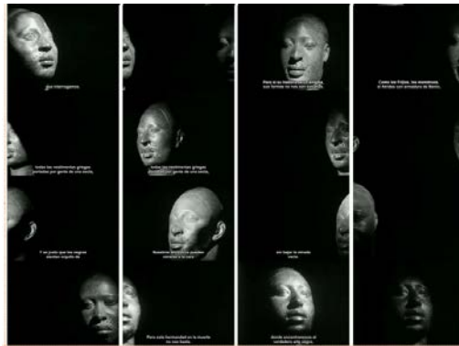
Foto 5: Fotogramas de la segunda secuencia de “Las estatuas también mueren”

La idea motriz del guión la podemos considerar idea temática en cuanto el tema es el punto de vista desde el que se considera la trama.