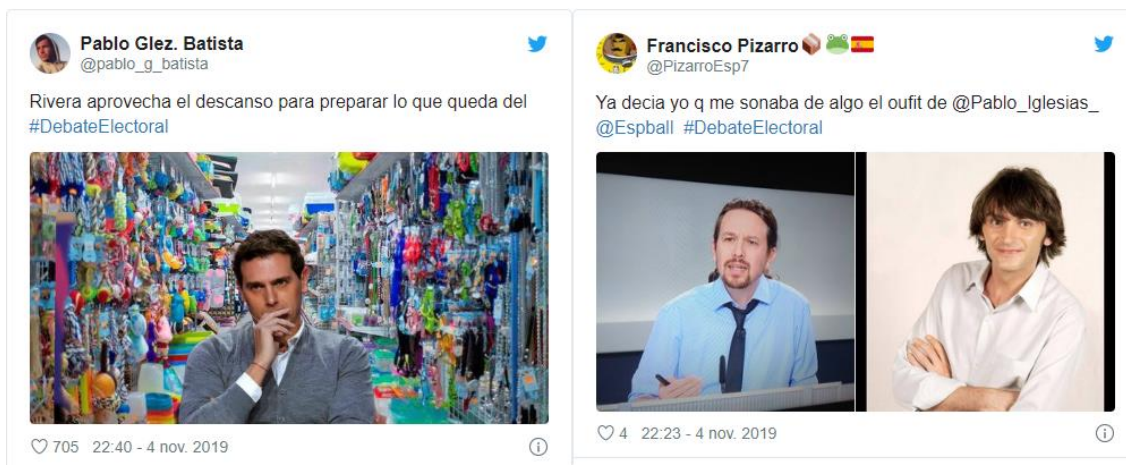
Ilustración 1: Twitter

En la categoría de humor/sarcasmo ha predominado el uso humorístico con un 69,4% de tweets , donde ha destacado la utilización del meme realizando referencias intertextuales a productos de la cultura de masas (Albert Rivera comparado con Joe Quimby de The Simpsons en el episodio en el que el alcalde intenta captar la simpatía de los periodistas con un cachorro, por ejemplo) o referencias intratextuales del debate (expresiones o gestos realizados por los candidatos; a modo de ilustración la equivocación de Pablo Iglesias al expresar manada/"mamada"). Se expone a continuación una breve compilación de imágenes gráficas humorísticas según su popularidad ( retweets ) en la red: