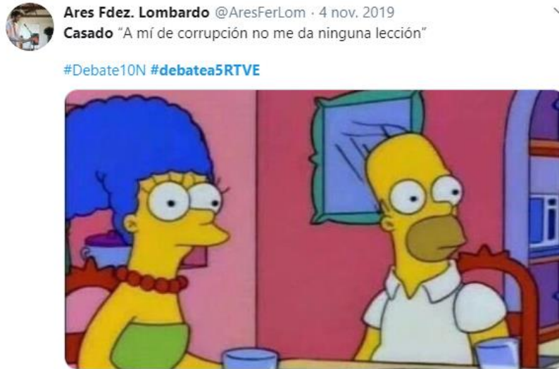
Ilustración 2: Twitter

‘Al menos nos hemos divertido’: respuestas en Twitter al debate electoral 4N.