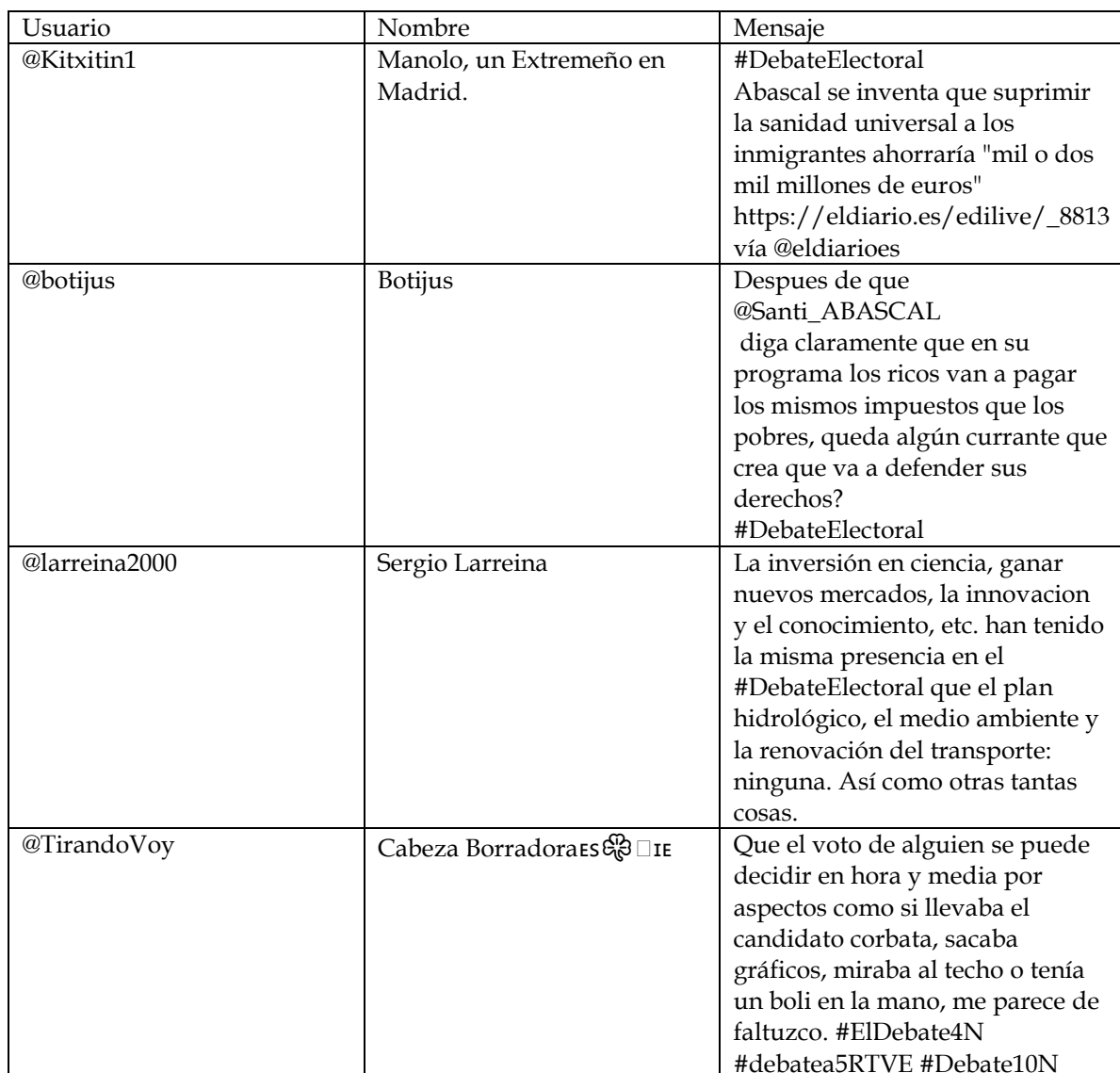
Tabla 4: Críticas

El candidato que ha recibido un mayor número de críticas por las propuestas que ha expresado en el debate electoral ha sido Santiago Abascal (6,52%), quien también ha sido el que ha obtenido más menciones positivas como candidato (7,61%). Pedro Sánchez, Pablo Iglesias y Santiago Abascal solo han obtenido un 1,09% de menciones que han elogiado sus propuestas.