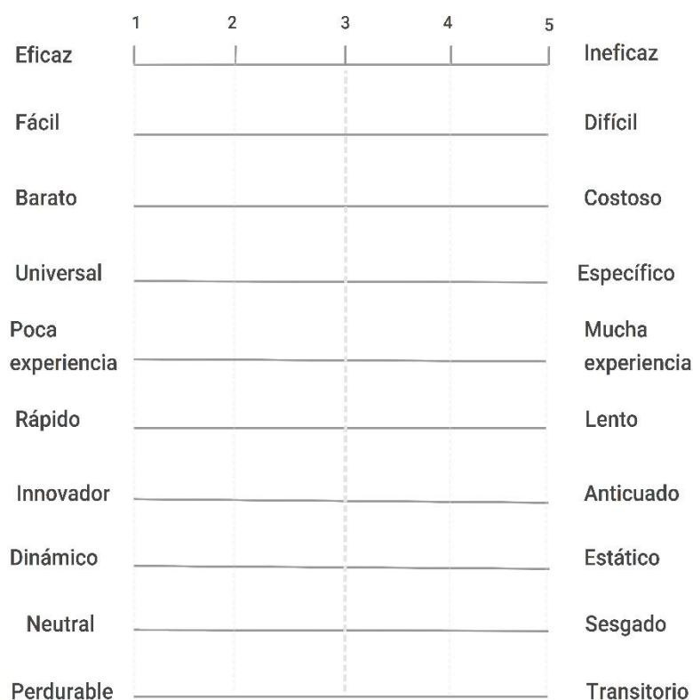
Figura 1. Diferencial semántico aplicado