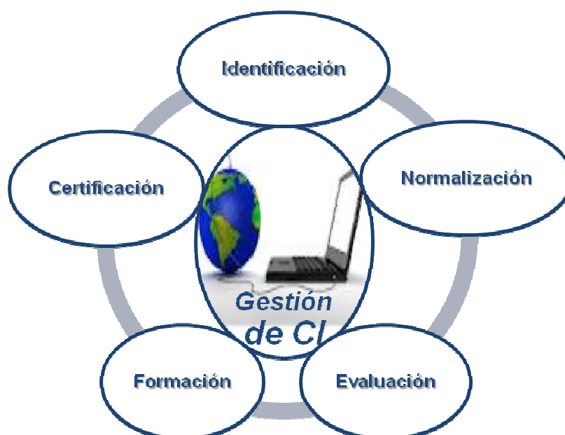
Esquema 1. Etapas de la gestión de C.I.

Tomando en cuenta el enfoque de competencias laborales (Gallart, y otros, 1995) (Mirabile, 1997) (Irigoin, 1998) (Cardona, y otros, 1999) (Vargas, 2004) se puede plantear que la identificación de competencias informacionales consiste en el establecimiento de las competencias relacionadas con la información, que determinan el desempeño exitoso de los individuos en una actividad determinada. Esta se ha realizado a través del desarrollo de modelos, de acuerdo con las particularidades y expectativas de escenario y circunstancia. En el marco del proyecto canadiense Test d'identification de competentes infomationnelles ( mapaweb.umontreal.ca/bernh/TICI ) se identifican más de 60 modelos a escala internacional. Dentro de los que se encuentran: Modelo de Marland (Marland, 1981); Recalling, Explaining, Analyzing, Challenging, Transforming and Synthesizing (REACTS) (Stripling, y otros, 1988); Information Seeking Process (ISP) (Kuhlthau, 1989); Big Six Skills Information Problem-Solving (Eisenberg, y otros, 1990); Modelo de Doyle (Doyle, 1992); Pathways of knowledge , Pappas y Tepe (Pappas, y otros, 1995); Purpose, Location, Use and Self-evaluation (PLUS) (Herring, 1996); 'Las siete caras de la alfabetización informacional' (Bruce, 1997); HEBORI (Benito, 2000); The Learning Connection Information Literacy and the Students (Lupton,