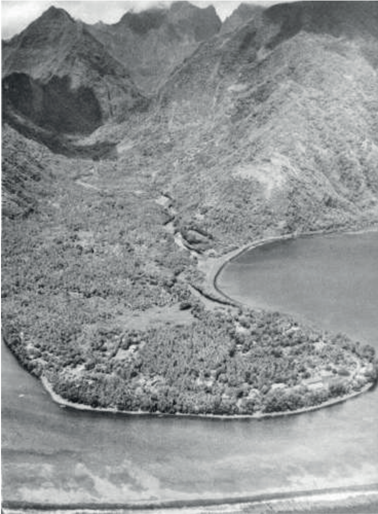
Foto aérea de Tautira.