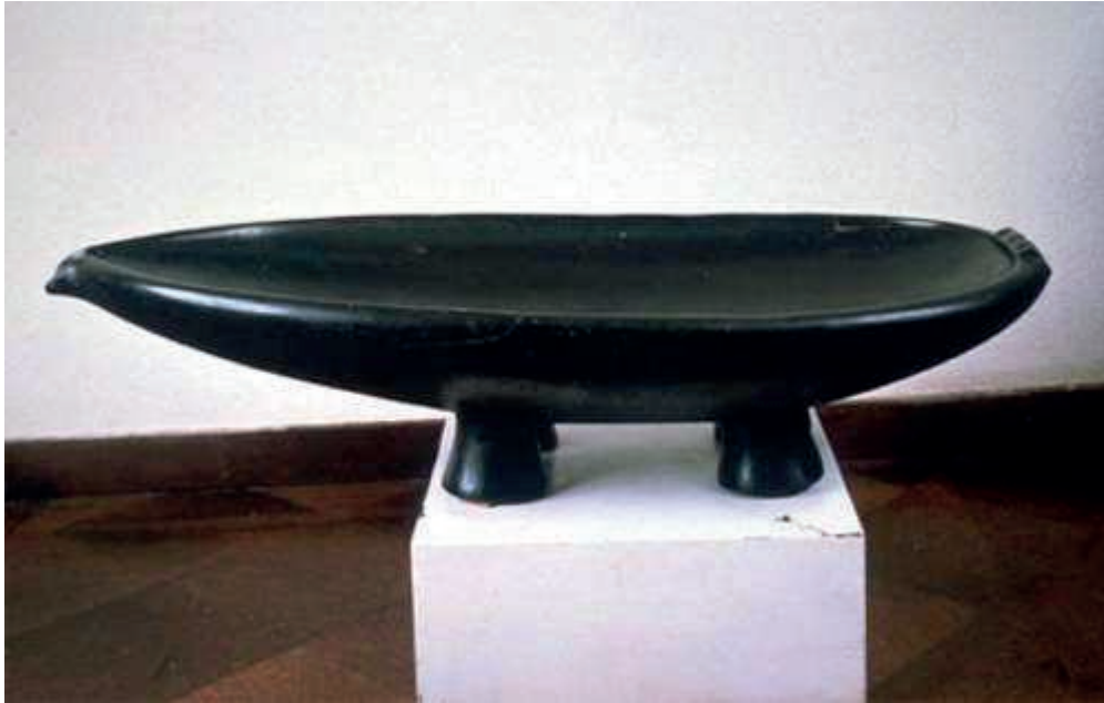
Cuenco de dolerita.

WEB del Museo Nacional de Antropología de Madrid.