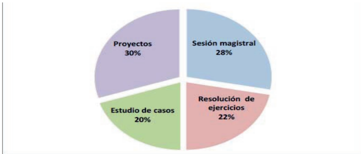
Figura 2. Distribución de la metodología empleada en el módulo.