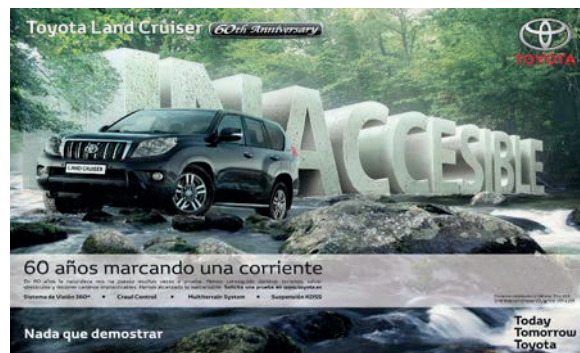
Imagen 3. Campaña de Toyota Land Cruise.