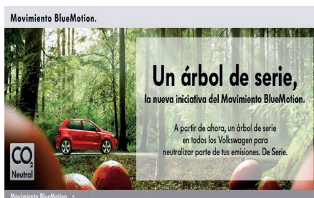
Imagen 9. Campaña Movimiento Blues Motions

a) El anunciante deberá revelar de forma explícita, inequívoca, y sin inducir a error, el alcance de su participación en el correspondiente acto o campaña benéfica.”