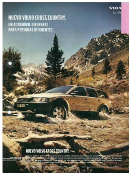
Foto1. Campaña de Volvo Cross

“Land Rover Freelander: Placentera sensación de libertad”. Sumido en la sabana africana.