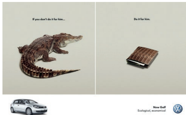
Imagen 10. Campaña de New Golf.

E incluso se atreven a establecer metáforas con claras intenciones moralizantes en sus últimas campañas para promocionar “El nuevo golf ecológico y económico” trasgrediendo de forma clara y explícita todos los códigos de autorregulación nacionales e internacionales. (Imagen 10.)