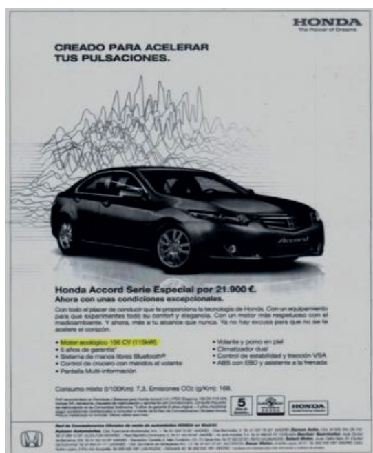
Imagen 7. Anuncio de Honda Accord

El jurado por lo tanto, instó a la marca a la rectificación de la publicidad. A pesar de que Honda es una de las empresas adheridas al Código medioambiental, no acató las disposiciones de Autocontrol, alegando que la notificación llegó cuando la campaña ya había terminado, llevando la rectificación del adjetivo “ecológico” por “eficiente” tan sólo en la web.