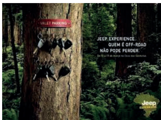
Imagen 5. Campaña de Jepp.