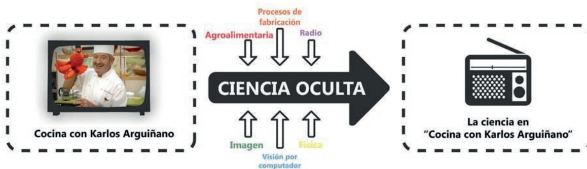
Figura 1. Objetivo del proyecto Arguiñano.

Uno de los principales retos planteados por el equipo multidisciplinar de profesores fue diseñar un plan suficientemente transversal que permitiera, de forma simultánea, desarrollar competencias específicas, propias de cada asignatura y competencias transversales, comunes a todas ellas. Entre las diferentes competencias transversales que se pudieran desarrollar en un proyecto fundamentado en el aprendizaje autónomo y compartido se consideraron: trabajar en equipo, diseñar propuestas creativas, comunicarse oralmente y por escrito, y utilizar tecnologías de la información y la comunicación.