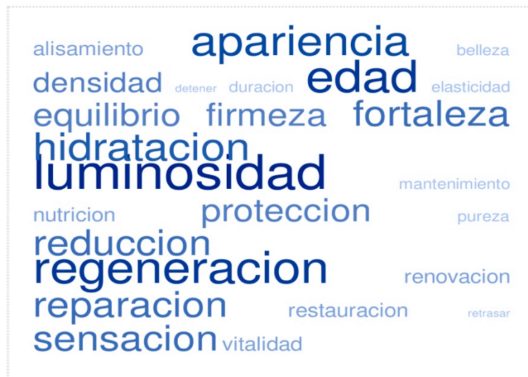
Ilustración 6 Beneficios

dirigidos retornar a la esencia natural (regeneración, reducción, reparación, restauración, equilibrio, vitalidad), enmascarando los efectos realmente probados de este tipo de productos (hidratación, sensación).