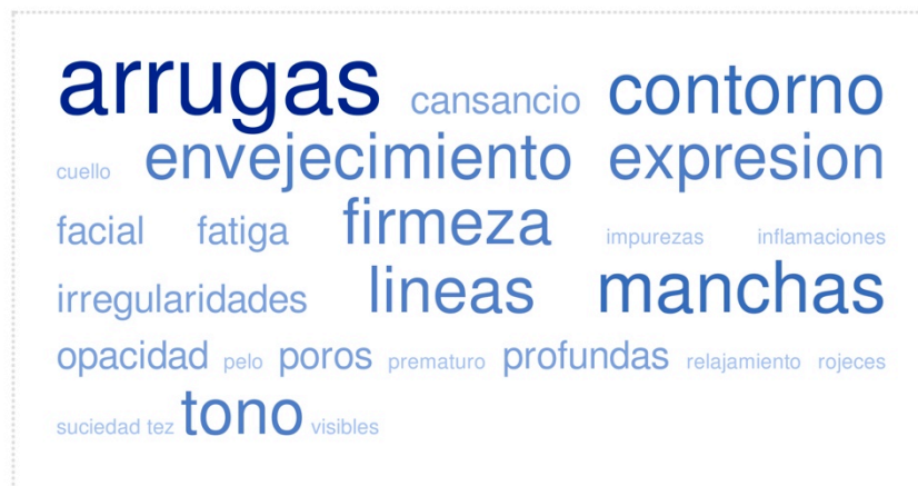
Ilustración 2 Síntomas

En un análisis más pormenorizado, se muestra el tipo de discurso con el que el proceso de envejecimiento se constituye en patología a partir de la identificación de los supuestos síntomas que así lo determinan. Aunque a veces se muestra como síntoma un envejecimiento en general del rostro, sobre todo se incide en síntomas concretos. Las arrugas son el signo más preocupante de esta supuesta patología, aunque también el contorno y las líneas, las manchas, la expresión, el tono, la firmeza, las irregularidades, o los poros. También se encuentran algunos términos de carácter más metafórico como opacidad, suciedad o impurezas.