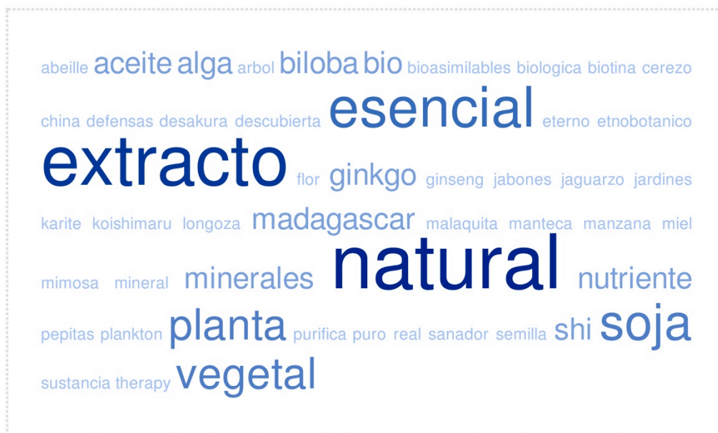
Ilustración 3 Naturaleza

La utilización de valores asociados a la Naturaleza se muestra con claridad con la utilización multitud de términos que envuelven los productos en discursos de autenticidad validados por una supuesta pureza primigenia natural (esencial, extracto), combinando ingredientes naturales con algunas dosis de exotismo (soja, aceite, alga, ginkgo, shi)