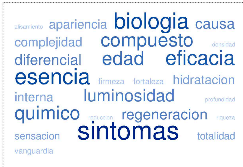
Ilustración 1 Categorías discursivas

En un análisis más pormenorizado, se muestra el tipo de discurso con el que el proceso de envejecimiento se constituye en patología a partir de la identificación de los supuestos síntomas que así lo determinan. Aunque a veces se muestra como síntoma un envejecimiento en general del rostro, sobre todo se incide en síntomas concretos. Las arrugas son el signo más preocupante de esta supuesta patología, aunque también el contorno y las líneas, las manchas, la expresión, el tono, la firmeza, las irregularidades, o los poros. También se encuentran algunos términos de carácter más metafórico como opacidad, suciedad o impurezas.