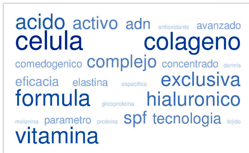
Ilustración 4 Ciencia

Como estrategia para paliar los síntomas se utilizan procedimientos que, con el auxilio de la tecnología abordan la cuestión utilizando un discurso metafórico de carácter bélico (combate, lucha) que ha de ser persistente y duradero (intensamente, continuada), además de incentivar la esencia natural del organismo (estimula, potencia, libera, interior) y ser flexible y efectivo (adapta, rápidamente, funde, global)